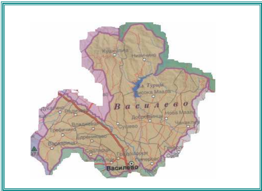
4. Монографија на Струмица 1996 год.

Покрај проширената алувијална рамнина, дел од општината, во северен правец се издига на јужните огранки на Малешевските Планини и северозападниот срт на Огражден, каде е изградена водената акумулација Турија, воедно зафаќајќи и дел од Планината Смрденик на југозапад. Општина Василево се простира на територија од 220,8 км 2 , со 12122 жители распоредени во 18 населби од кои 2 се сосема раселени. Просечната густина на населеност од 55,4 жители на 1 км 2 , ја вбројува општината во средно големите општини во Струмичкиот регион. Седиштето на општината е во истоимената населба Василево, населена со 2174 жители , а останатиот дел од општината ја сочинуваат Градашорци 1744 жители , Пиперево 1401 жител , Добрашинци 936 жители , Ангелци 913 жители , Нова Маала 823 жители , Сушево 723 жители , Владиевци 684 жители , Чанаклија 598 жители , Радичево 590 жители , Висока Маала 497 жители , Дукатино 450 жители , Седларци 343 жители , Едрениково 225 жители , Требичино 19 жители , Варварица 2 жители и раселените Кукушлија и Нивичино. Од нив 8 се рамничарски а останатите 8 се ридски населени места. Општина Василево на исток се граничи со Општина Босилово, на запад со Општина Радовиш, Подареш и Конче. На север со Општина Берово, а на југ со општина Струмица. Пристапноста до општината е добро отворена. Магистралниот пат М6 Струмица-Радовиш-Штип и неколкуте околни локални патишта, Општина Василево ја поврзува со целиот регион. 4