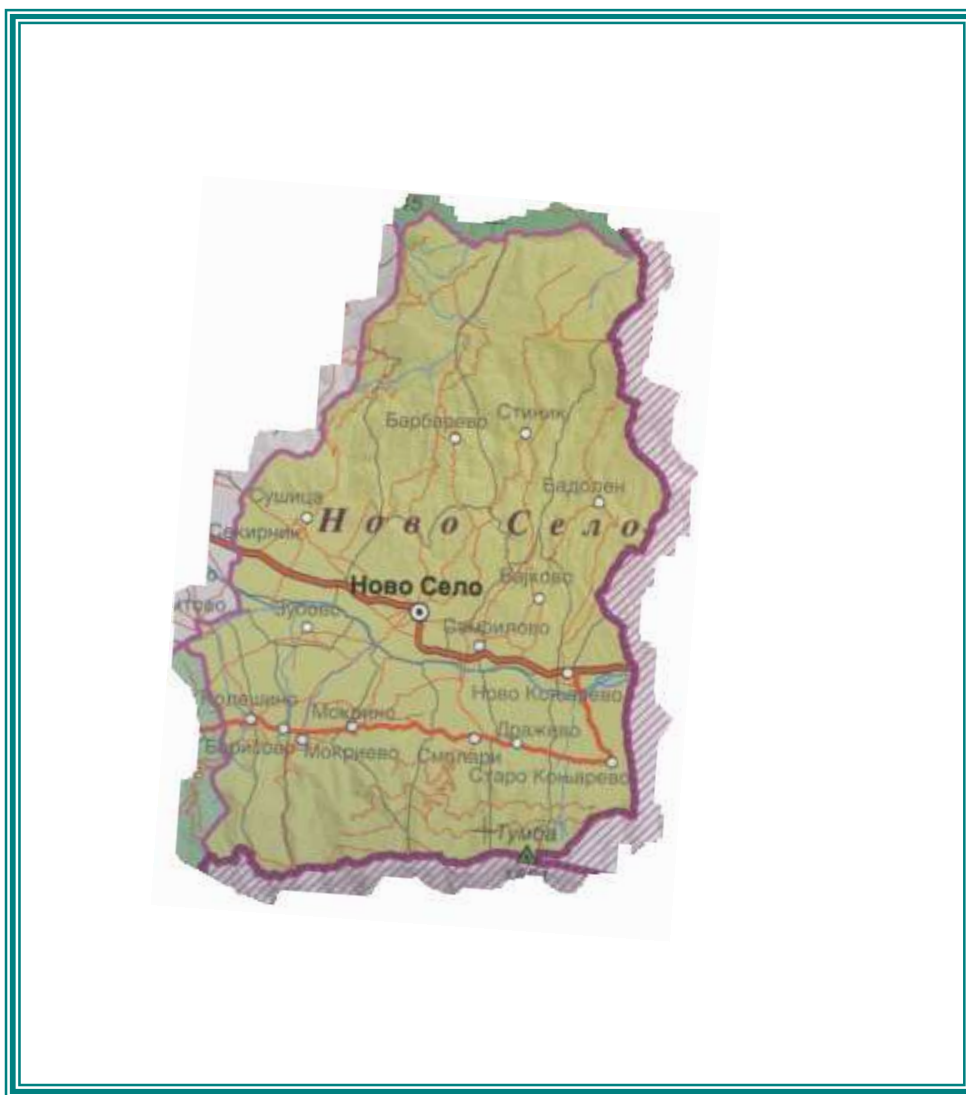
2.Монографија на Струмица 1996 год.

Со магистралниот пат М6 и регионалниот пат Р-605 , општината е поврзана со останатите општини и непосредно со граничниот премин со Република Бугарија. 2